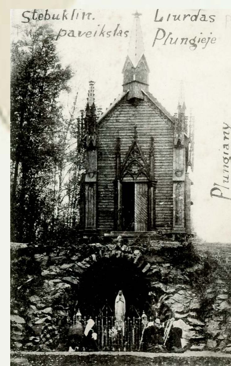
Plungės Lurdas. XX a. trečiasis dešimtmetis