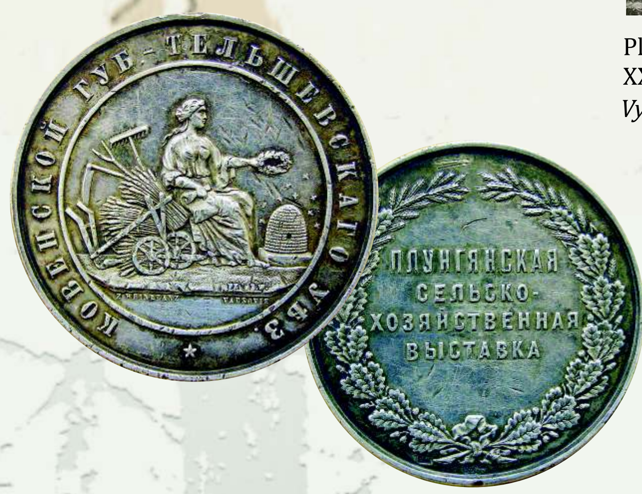
Plungės žemės ūkio parodos medalis (1899). Dailininkas S. Weinkranz