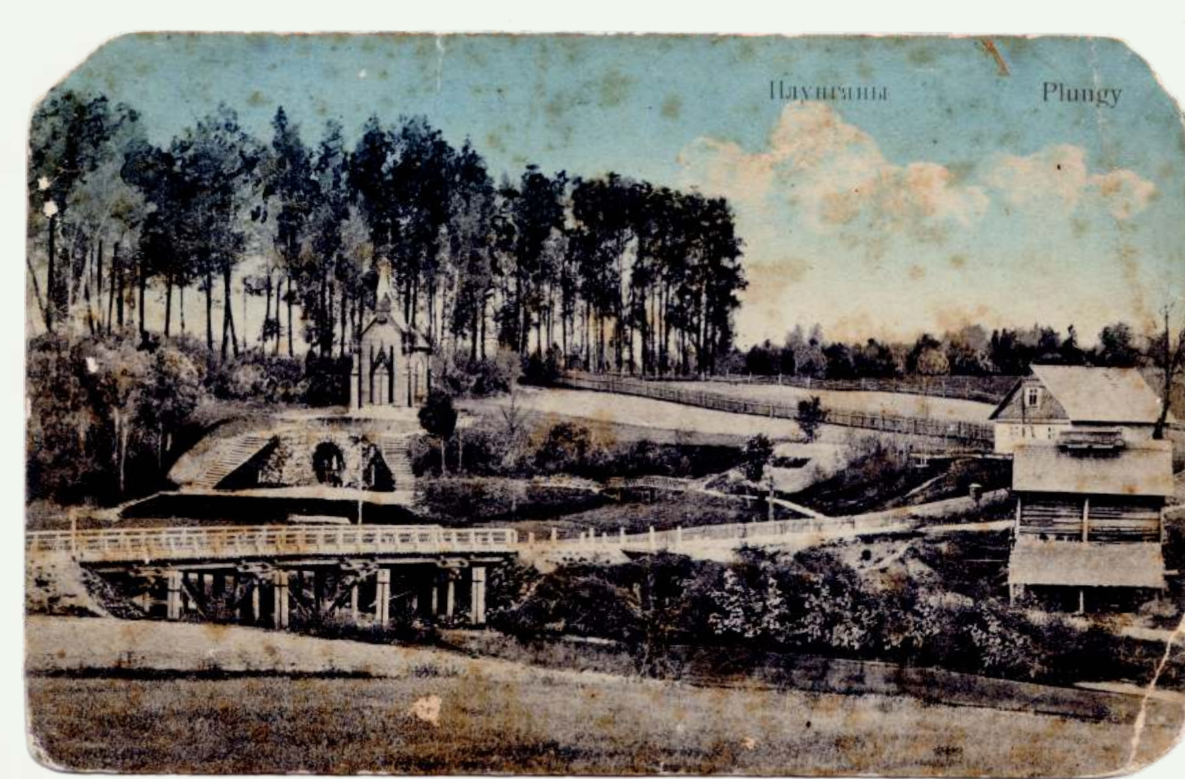
Plungės Lurdas. 1912 m.