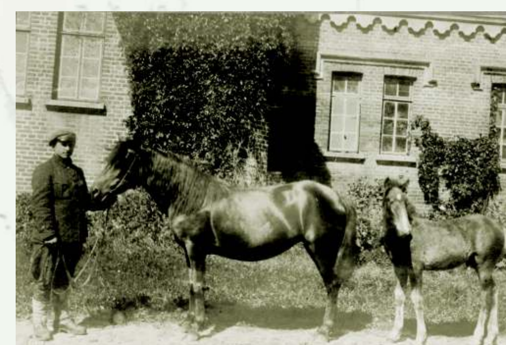
M. M. Oginskio Plungės dvaro žirgnas, kuriame veisti ir auginėti žemaitiškų žirgai. XX a. antrasis - trečiasis dešimtmečiai