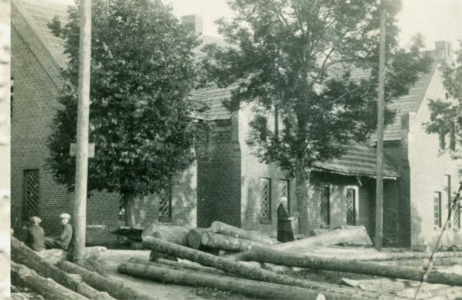
M. Oginskienės našlaičių prieglaudos pastatas. XX a. trečiasis dešimtmetis