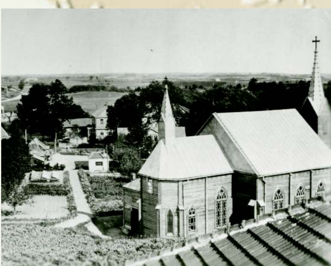
Lurdo koplyčia. 1933 m.