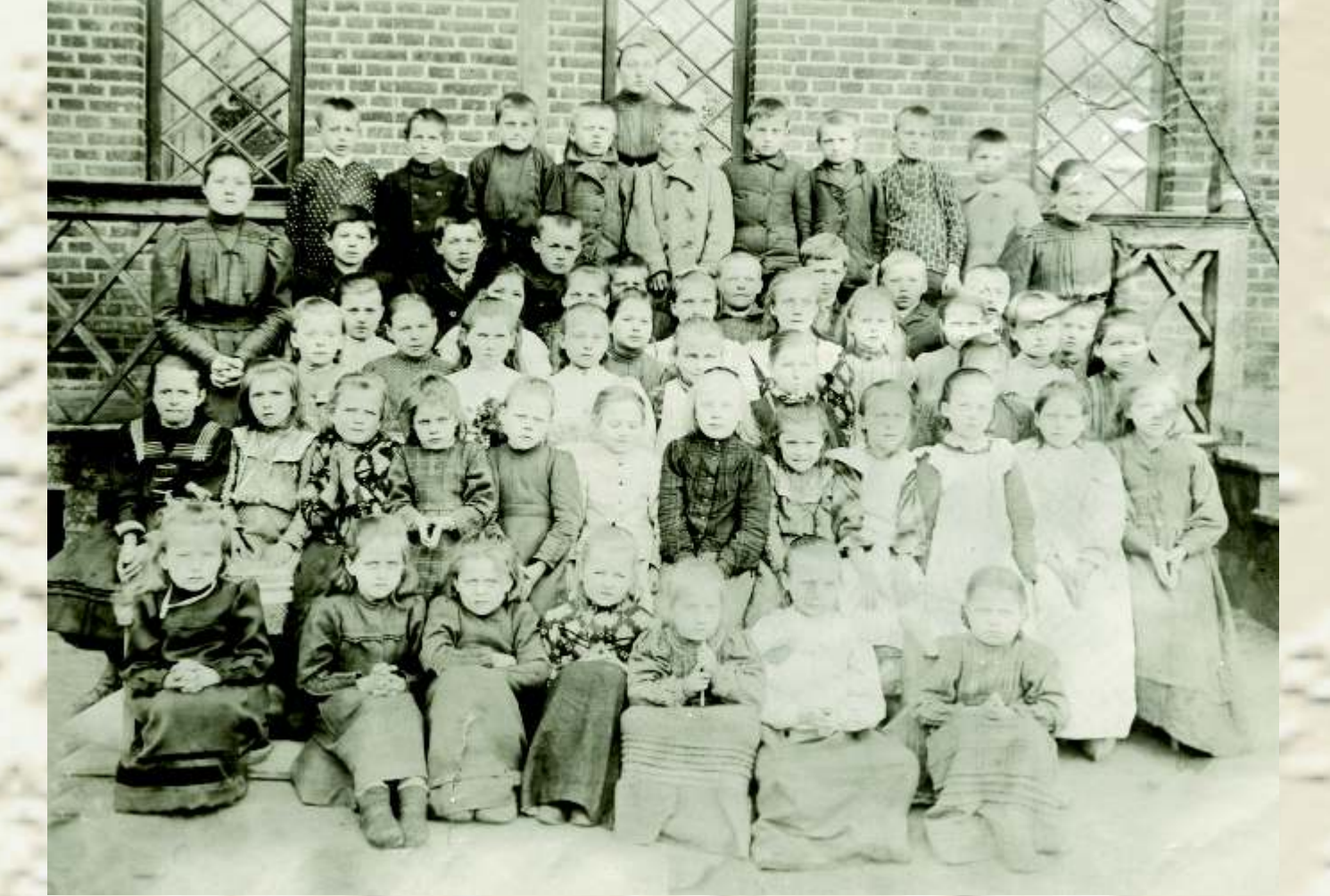
Našlaičių prieglaudos vaikai su auklėtojomis. XX a. pradžia