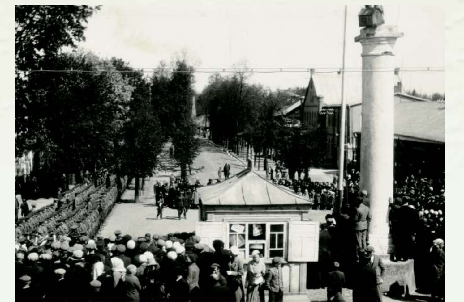
Liepų bulvaro vaizdas. XX a. trečiasis dešimtmetis