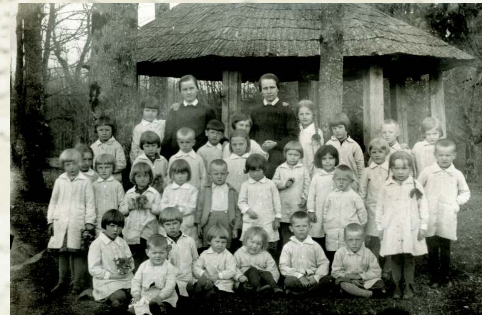
Našlaičių prieglaudos vaikai prie pavėsinės. Plungė, 1909-1910 m.