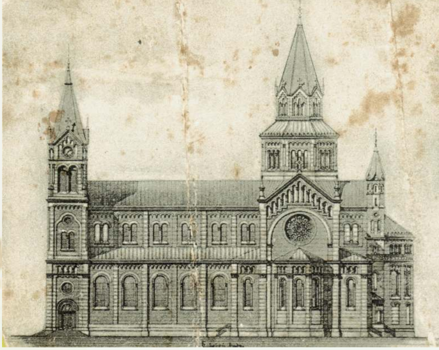
Plungės šv. Jono Krikštytojo mūrinės bažnyčios projektas. XIX a. pab. - XX a. pr.