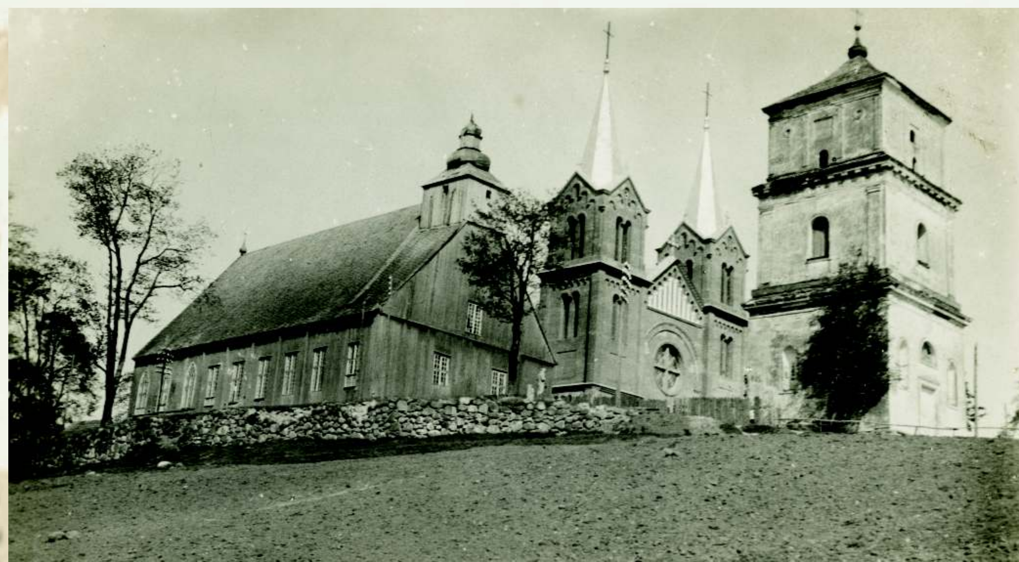
Plungės šv. Jono Krikštytojo senoji medinė ir naujoji mūrinė bažnyčia. 1934 m.